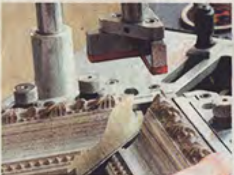
Spiegel, Bilderrahmen, Magnetboards